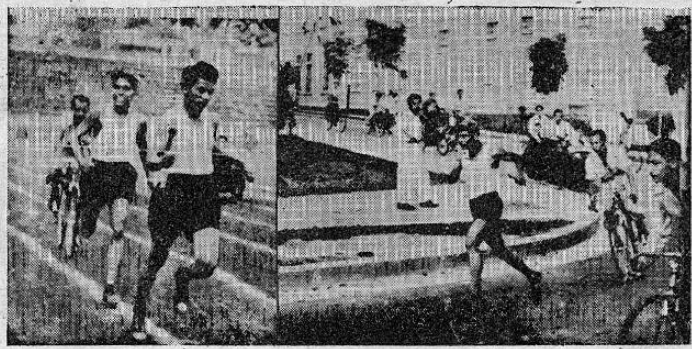
Ofrecemos a nuestros lectores otras gráficas captadas por KIKO el domingo recién pasado en momentos en que los vocadores de periódicos que participaron en la carrera de relevos, organizada por la Federación de Atletismo, llegaban a la pista del Estadio Nacional en una competencia llena de virilidad y colorido.

En ambas fotografías puede verse a los corredores más veloces que llevaron la delantera. Como lo informamos en una de nuestras ediciones anteriores, en esta carrera obtuvo el primer puesto Diario Latino y el segundo EL GRAN DIARIO LA NACION.